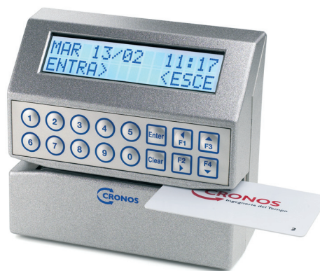
Terminale M20 magnetico

Cronos ERGO opera in ambiente Windows 95/98, NT, 2000, XP, utilizza Database Microsoft Access ed è stato sviluppato in Visual Basic 6 e Cristal Report 4,6.