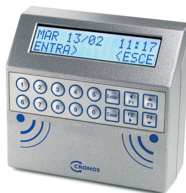
Terminale M20 prossimità